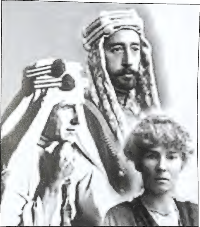
فيصل بين لورانس في مرحلته الأولى إلى السيدة غيرترود بيل في مرحلته الثانية

من المؤرخين البريطانيين، وبالأخص في سياق ما كتب عن عام 1917، عندما قرر ضابط الاستخبارات البريطاني المغامر، توماس إدوارد لورانس، اختيار فيصل... ليجري تسويقه على أنه ممثل «الثورة العربية» التي كان يجري التخطيط لها للإطاحة بالخلافة العثمانية في شبه جزيرة العرب (3) .